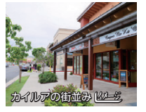
カイルアの街並み