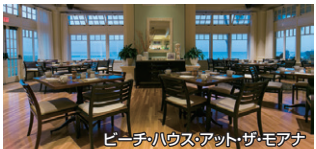
ビーチ・ハウス・アット・ザ・モアナ

モアナ サーフライダー ■レストラン/ビーチ・ハウス・アット・ザ・モアナ ■対象コース/カップル:モアナ サーフライダー 同行者:対象ホテル(★) ■予約可能時間/17:30~21:00 (18:30~19:30を除く) ■予約コード/SF3202 ■追加料金(お1人)/6名まで:無料 7人目以降大人:16,000円、子ども7,000円