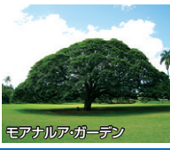
モアナア・ガーデン