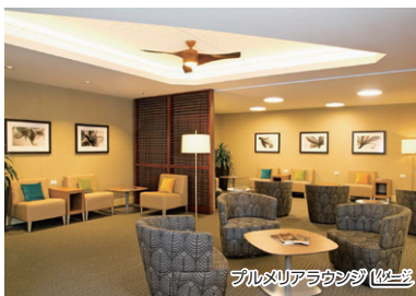
プルメリアラウンジ

*混雑状況によりご利用いただけない場合があります。 *片道のみご利用の場合は、ご利用区間の国際線出発空港ラウンジに限りです。 *詳しくはハワイアン航空ホームページをご確認ください。