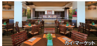
カイ・マーケット

シェラトン・ワイキキ ■レストラン/カイ・マーケット ■対象コース/カップル:シェラトン・ワイキキ 同行者:対象ホテル(★) ■予約可能時間/17:30~21:00 ■予約コード/SF3316 (18:30~19:30を除く) ■追加料金(お1人)/6名まで:無料 7人目以降大人:14,000円/子ども:6,000円