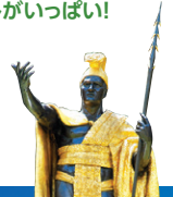
カメハメハ大王像