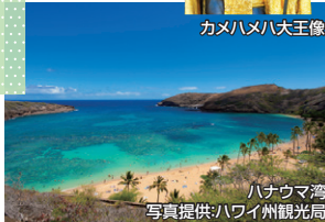
ハナウマ湾

■車いすご利用のお客 さまもご参加いただけ ますが、一部車い すでの移動に過ぎない 場所(モアナア・ ガーデン)があります。