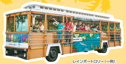
レインポートロリー(一例)