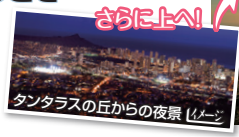
タンタラスの丘からの夜景

*オアフ島到着日は参加可能(到着日参加の事前予約不可・現地申込のみ)。*帰国日は参加不可。*交通ルートの都合上、バンなど小型の車種を使用します。*風が強く、寒い場合がありますので上着などをご用意ください。*天候により、当日開催中止となる場合があります。その際は参加料金20ドルを返金いたします。*催行中止になった場合、翌日参加に希望する場合でも、予約状況によりお席を確保できるとは限りません。*サンセットの時間にあわせて出発しますので、左記時刻は目安となります。集合・出発時刻は現地にて再度ご確認ください。*車いすご利用のお客さまは、安全上の理由によりご参加いただけません。